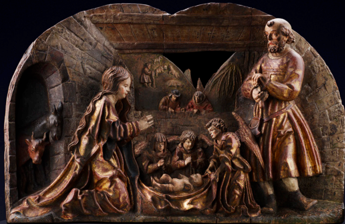
MATTHÄUS KRINIS (tätig in Altbayern, erstes Viertel des 16. Jahrhunderts) GEBURT CHRISTI

Oberbayern, um 1518 Hochrelief, Lindenholz Höhe: 45 cm; Breite: 68 cm