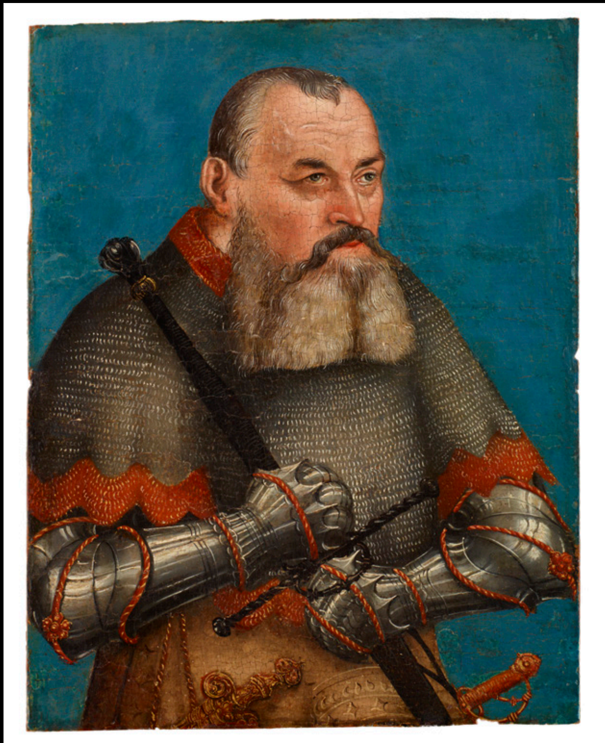
LUCAS CRANACH DER ÄLTERE UND WERKSTATT (Kronach 1472 - 1553 Weimar) HERZOG HEINRICH DER FROMME VON SACHSEN (1473 - Dresden - 1541)