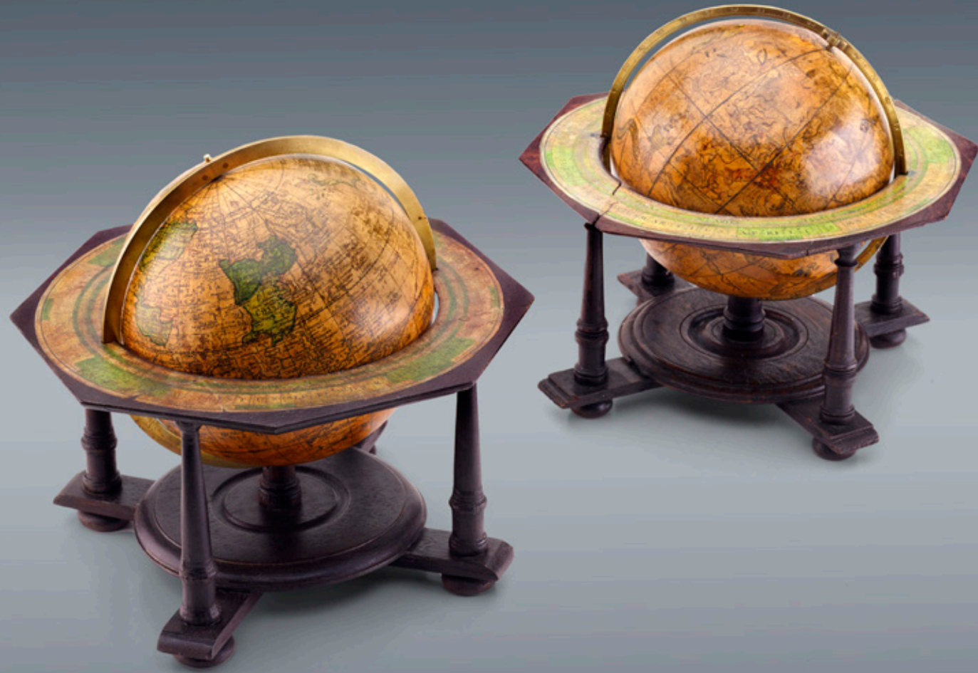
JOHANN GABRIEL DOPPELMAYR (1677 - Nürnberg - 1750) HIMMELS- UND ERDGLOBUS ALS PAAR Nürnberg, datiert 1730 | Kolorierte Kupferstiche, Papiermaché, Holz, Meridianring Messing | Höhe ca: 30 cm, Durchmesser: 19,5 cm CELESTIAL AND TERRESTRIAL GLOBE Nuremberg, dated 1730 | Coloures chalcography, papier mache, wood, meridian ring brass | Height ca: 30 cm, diameter: 19.5 cm