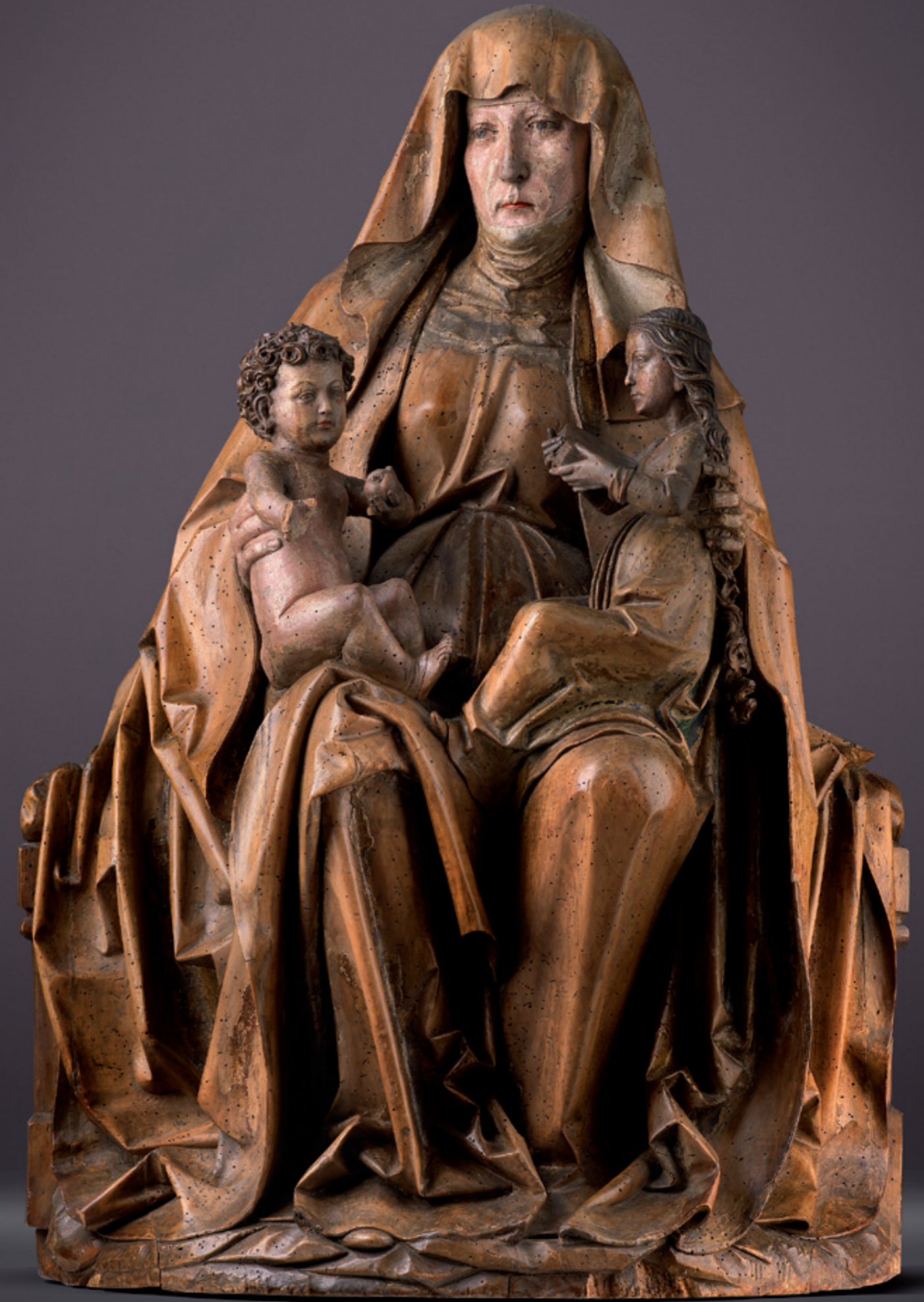
Anna Selbdritt Gruppe Umkreis Tilman Riemenschneider (1460 Heiligenstadt - 1531 Würzburg), um 1520 Lindenholz, mit Restspuren der originalen Fassung, Höhe: 97 cm Provenienz: Diese Skulptur war ursprünglich als Leihgabe von 1985-2007 im Mainfränkischen Museum in Würzburg