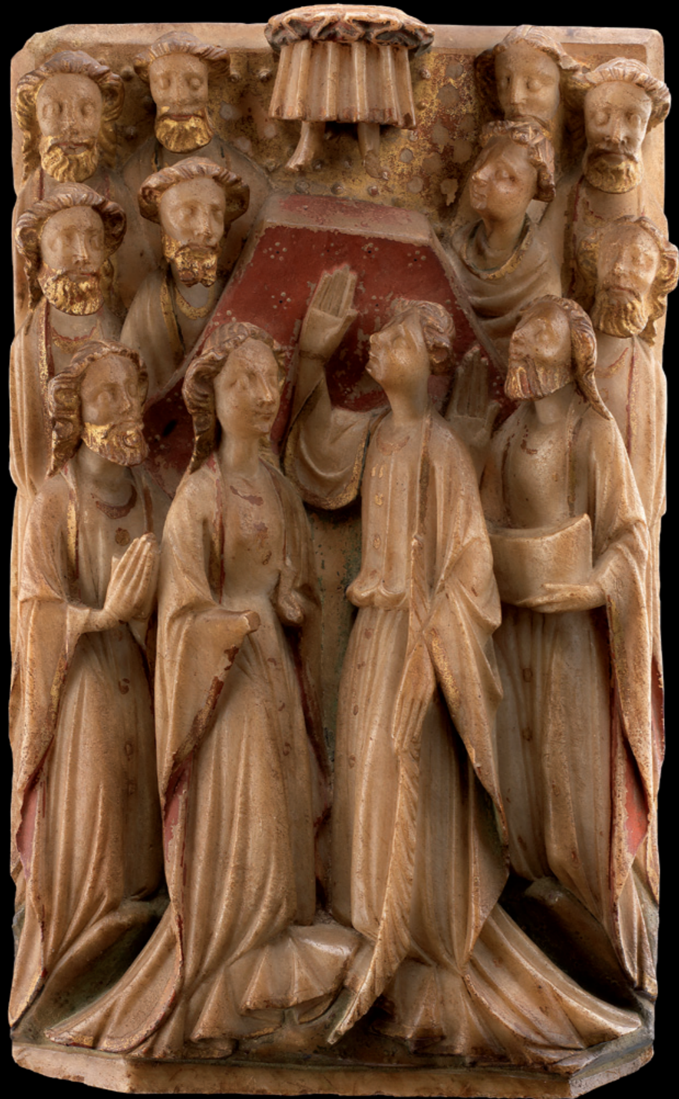
Himmelfahrt Christi England, Nottingham, zweite Hälfte des 15. Jahrhunderts Alabaster, ursprünglich Teil eines Flügelaltars Höhe: 39,5 cm, Breite: 24,5 cm