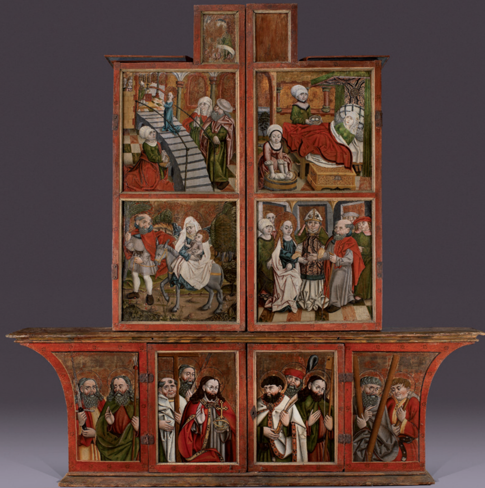
Marienaltar mit Szenen aus dem Marienleben: Geburt Mariens, Tempelgang Mariens, Vermählung Mariens, Flucht nach Ägypten aus der Klosterkirche im Dorf Christgarten (Lkr. Donau-Ries, Schwaben) um 1480 ursprünglich zugehörige Skulpturen von Meister Paul Ypser, Nördlingen, um 1480 Höhe: 276 cm, Breite: 266 cm, Tiefe: 39 cm

Provenienz: Fürst Moritz zu Oettingen-Wallerstein Literatur: Liedke, Volker: Der spätgotische Verkündigungsalter in der ehemaligen Karthäuserklosterkirche Christgarten bei Nördlingen, in: Ars bavarica , Bd. 59/60, 1989, S. 45-58.