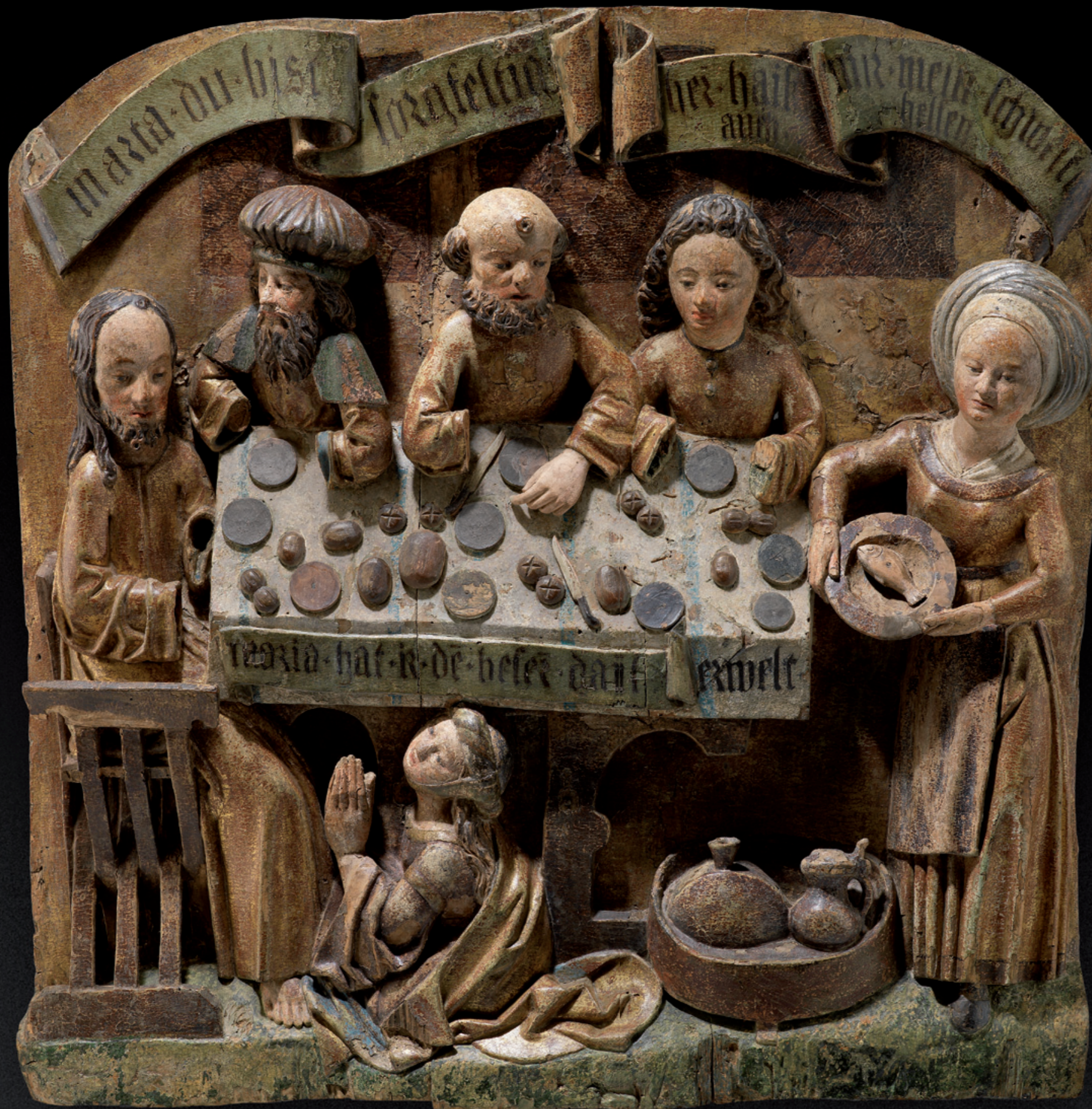
Jesus zu Gast bei Martha und Maria Süddeutschland, um 1520 Relief, Lindenholz, alte Fassung, ursprünglich Teil eines Altaraufsatzes Höhe: 61,8 cm, Breite 60,6 cm, Tiefe: 8,4 cm