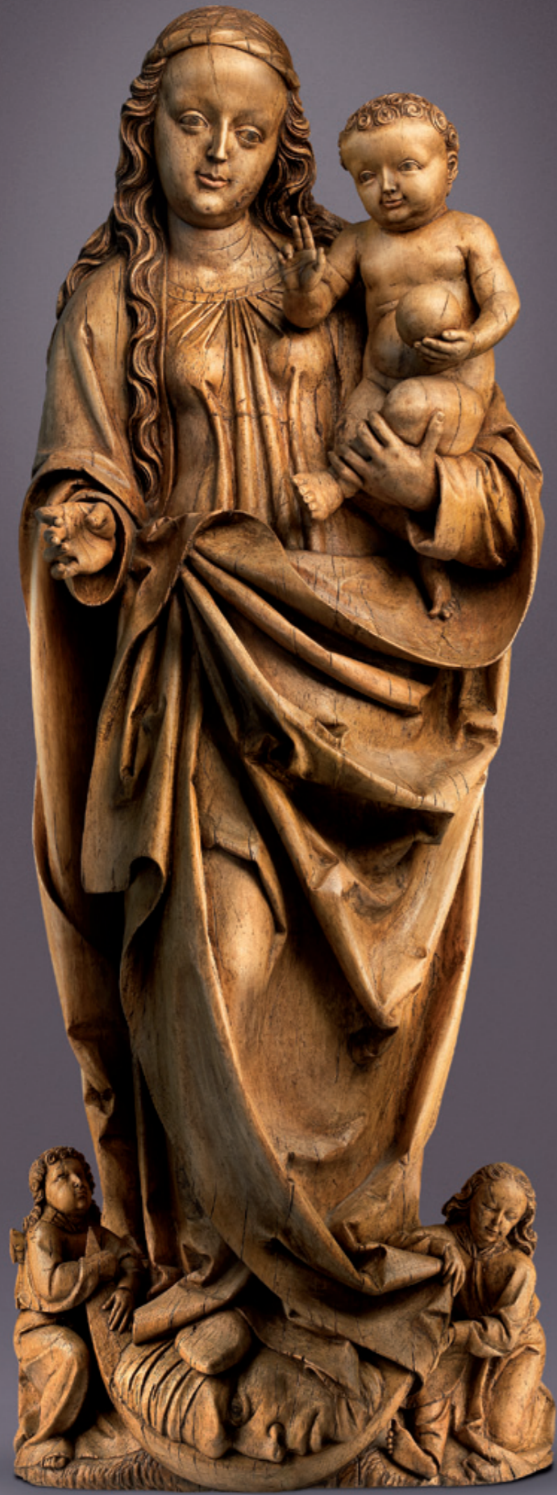
Muttergottes mit Kind Umkreis Veit Stoss (um 1447 Horb am Neckar – 1533 Nürnberg) Nürnberg, um 1500 Lindenholz, rückseitig gehöhlt Höhe: 144 cm