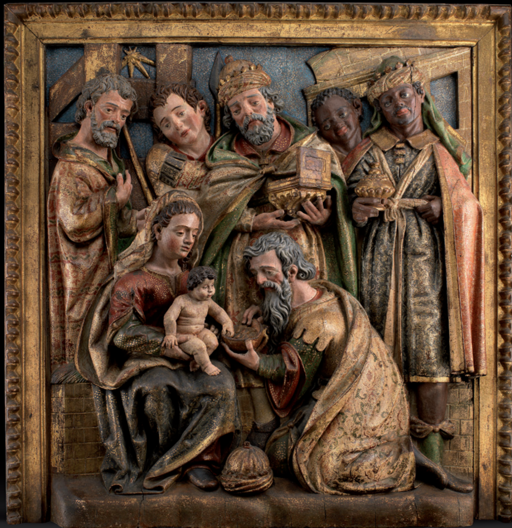
Anbetung der Könige Spanien, um 1550 Weichholz, originale Fassung Höhe, 135 cm, Breite: 127 cm