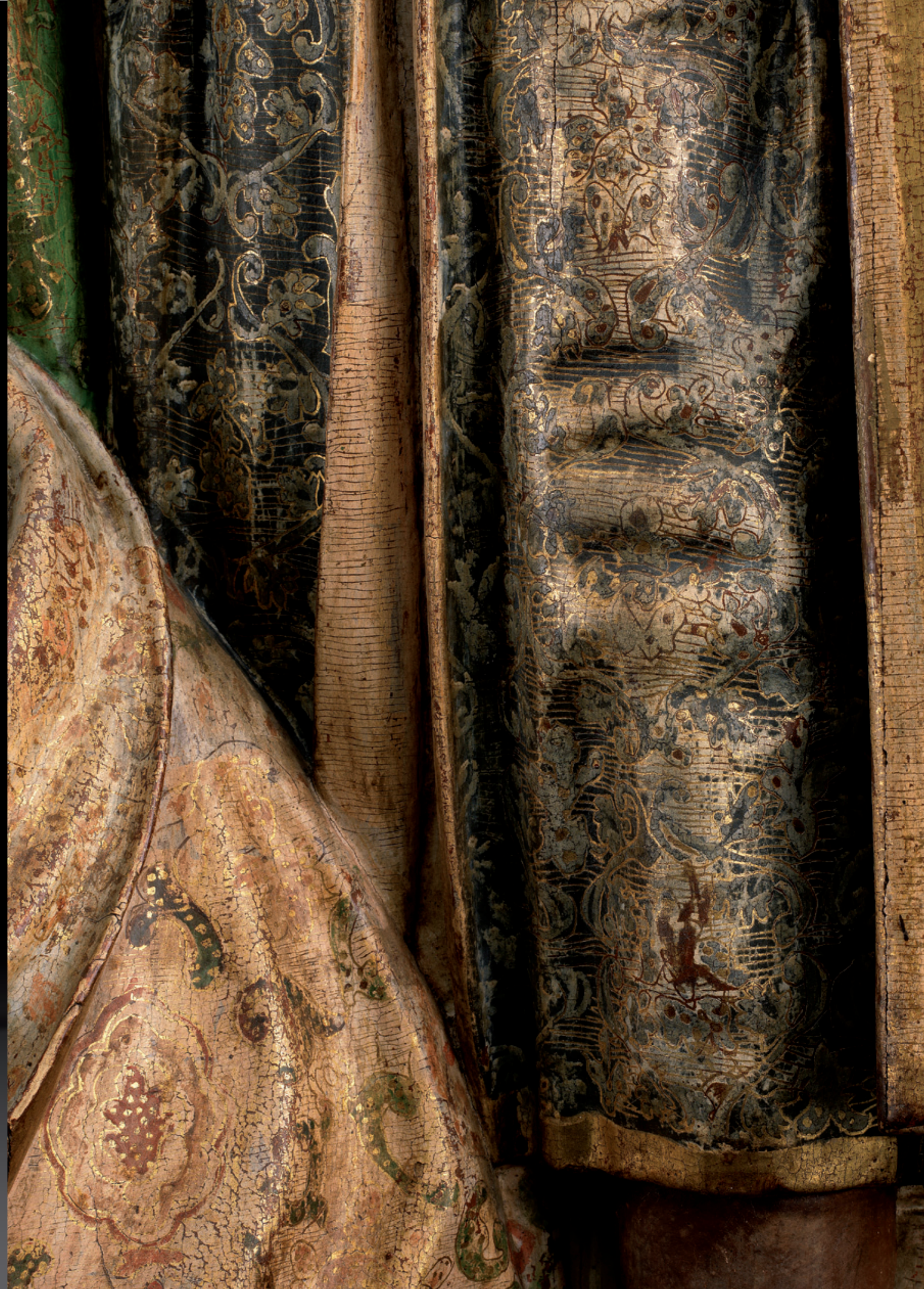
The adoration of the Magi Spain, circa 1550 Pinewood, original polychrome Height: 135 cm, Width: 127 cm