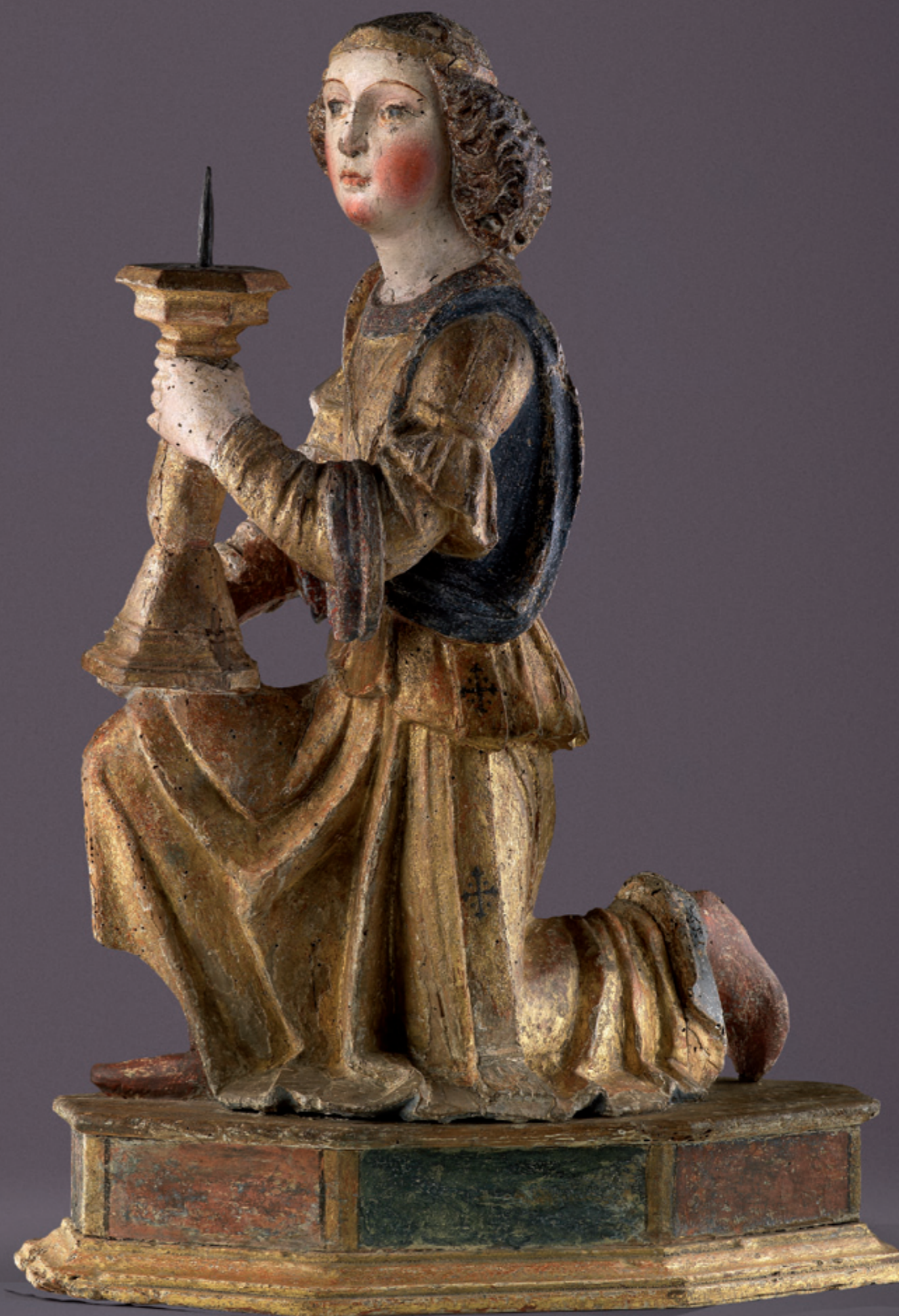
Ein Paar gotische Leuchterengel Lombardei, um 1420 alte Fassung Höhe: 62,5 cm, Breite: 44 cm, Tiefe: 24 cm