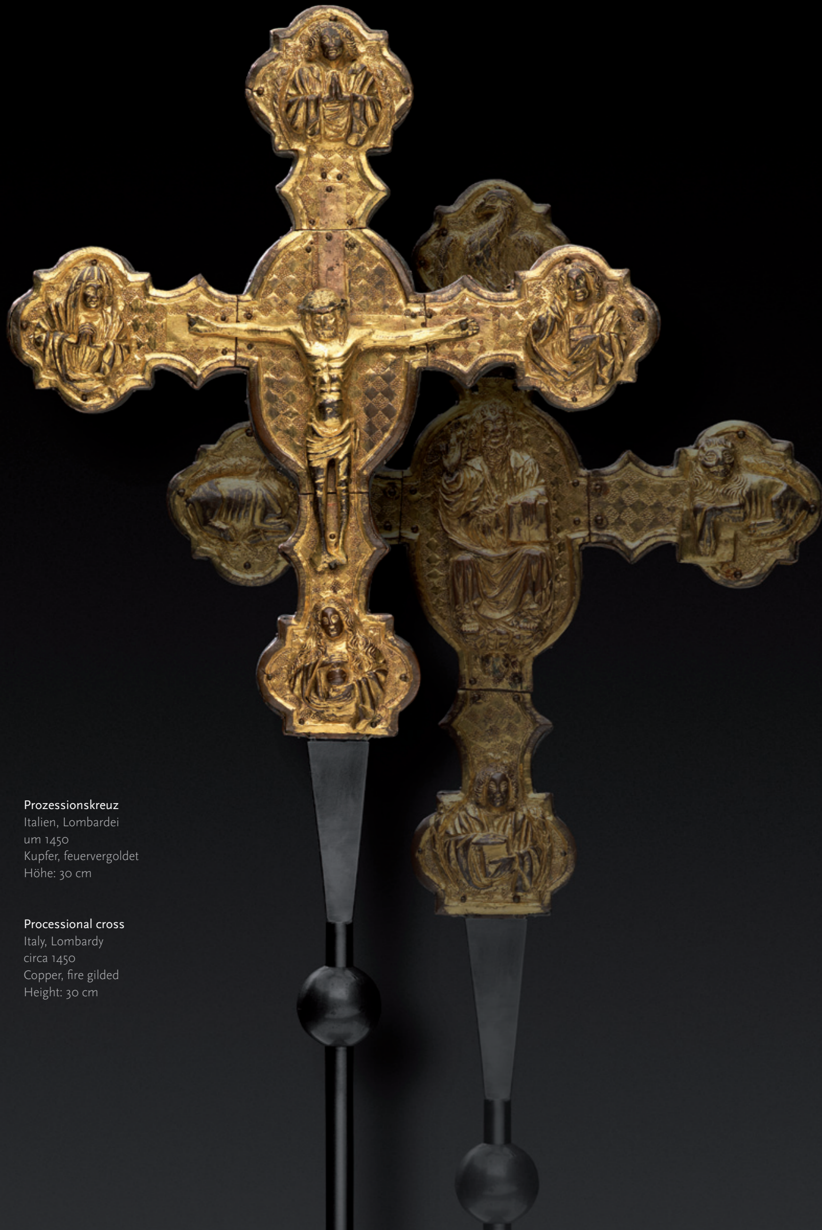
Prozessionskreuz Italien, Lombardei um 1450 Kupfer, feuervergoldet Höhe: 30 cm