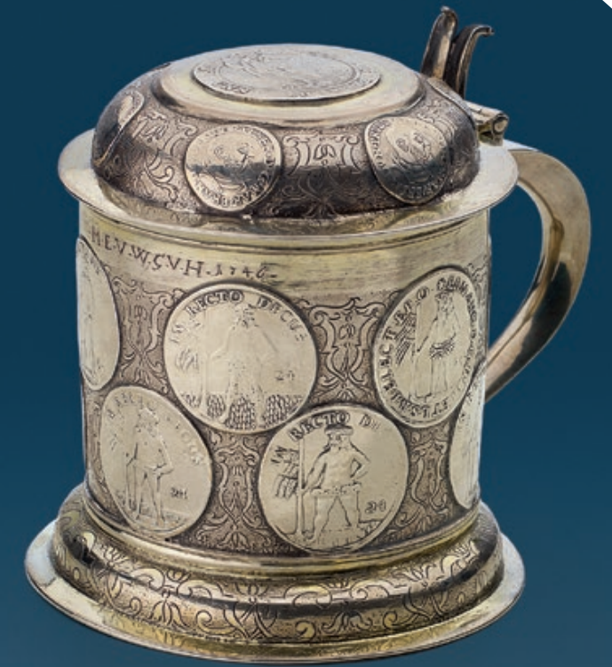
Rare Coin-set Tankard Zary (Sorau) in Lower Lusatia (western Poland), 1720-1730 Marking: S (Sorau/Zary) above W (Wroclaw) Body inset with 12 big Wildemann-coins Silver, traces of gilding Weight: 634 g, height: 13 cm