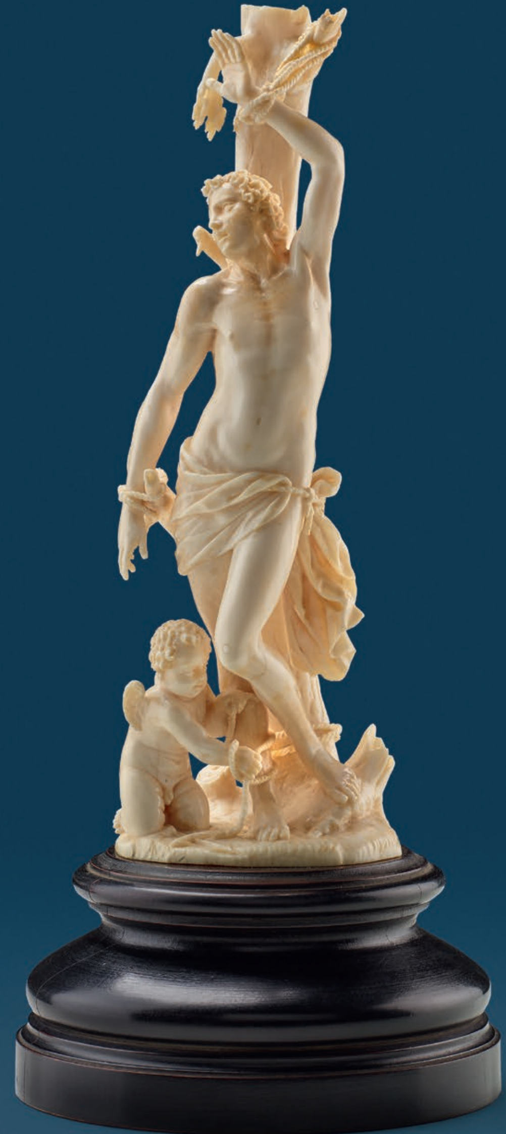
Saint Sebastian South German, circa 1700 Ivory, full-round sculpture Height: 19,5 cm