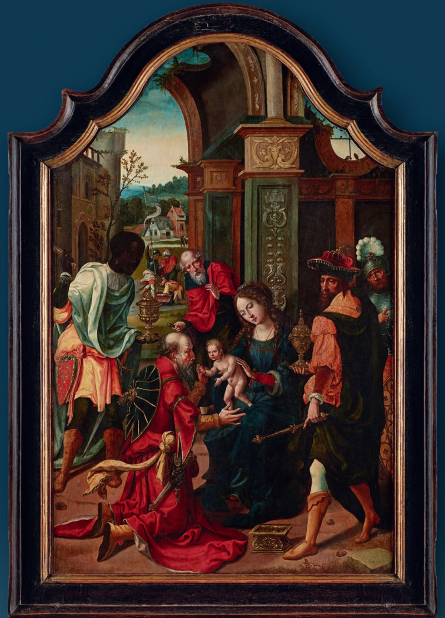
„Adoration of the Magi“ Follower of Pieter Coecke van Aelst the Elder (1502 Aelst – 1550 Brüssel) Brussels, circa 1525/1530 Oil on wood Height: 105,5 cm, width: 69 cm