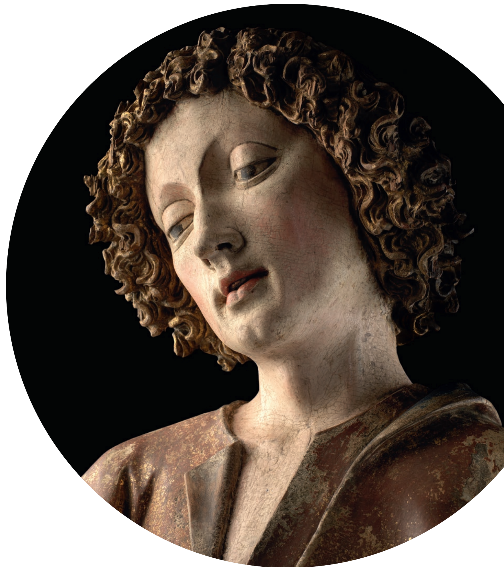
Heiliger Johannes Meister Michael Pacher (um 1435 vermutlich in Mühlen bei Pfalzen, Tirol - 1498 Salzburg) Südtirol, Bruneck (Pustertal) um 1485/90 Zirbenholz, rückseitig geflacht, originale Fassung Höhe: 104 cm