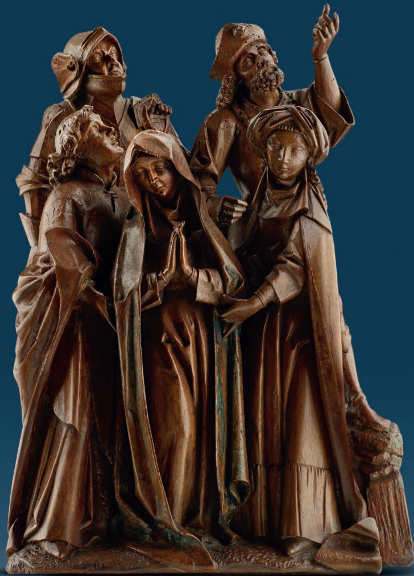
„Beweinungsgruppe“ Brüssel, um 1500 Nussbaumholz, vollrund geschnitzt Höhe: 44 cm, Breite: 30 cm, Tiefe: 15 cm