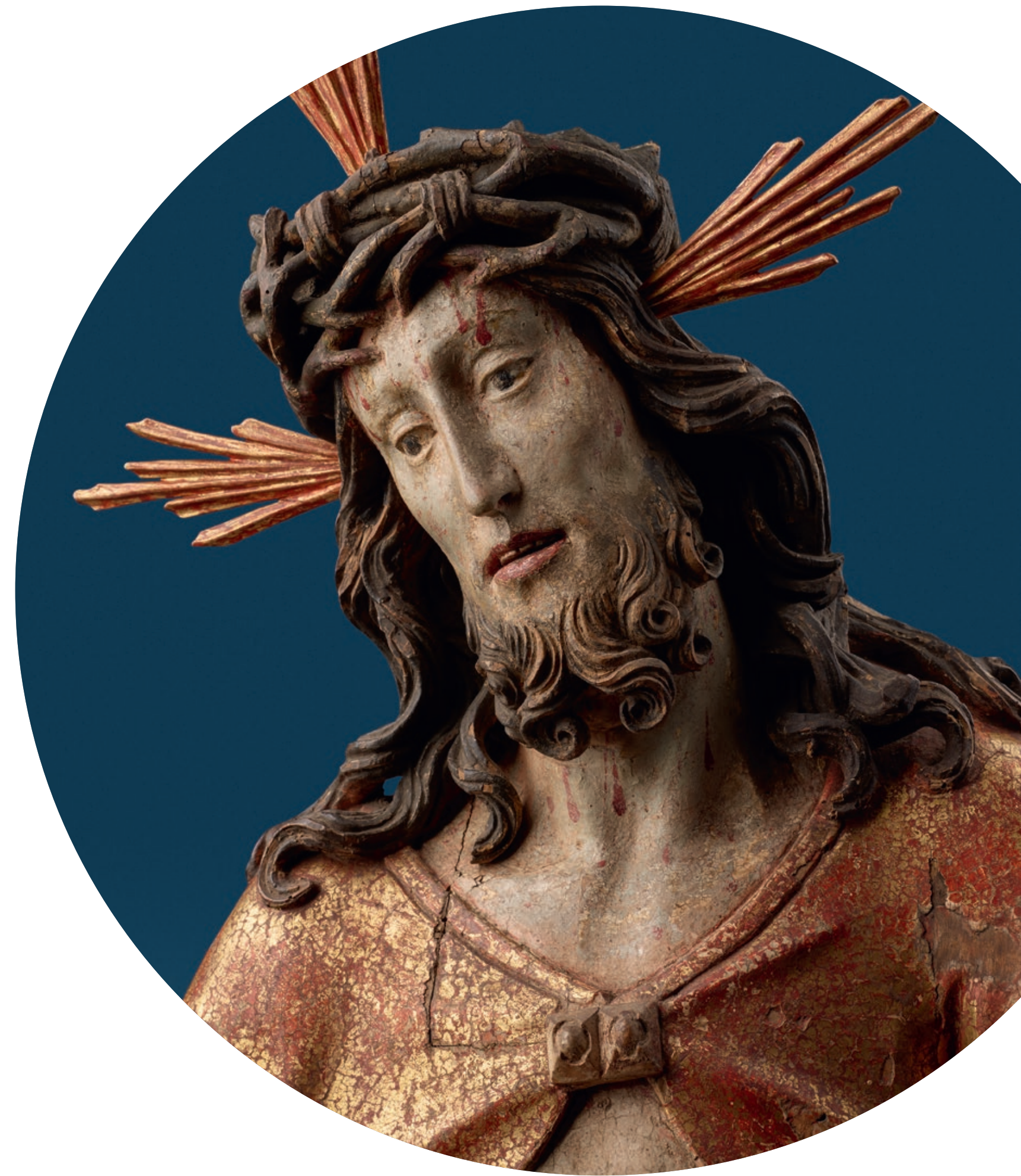
Auferstehungschristus Werkstatt Michel Erhart (um 1440/45 – nach 1522, tätig in Ulm) Ulm, um 1490/95 Lindenholz, Rückseite gehöhlt, originale Fassung Höhe: 157 cm