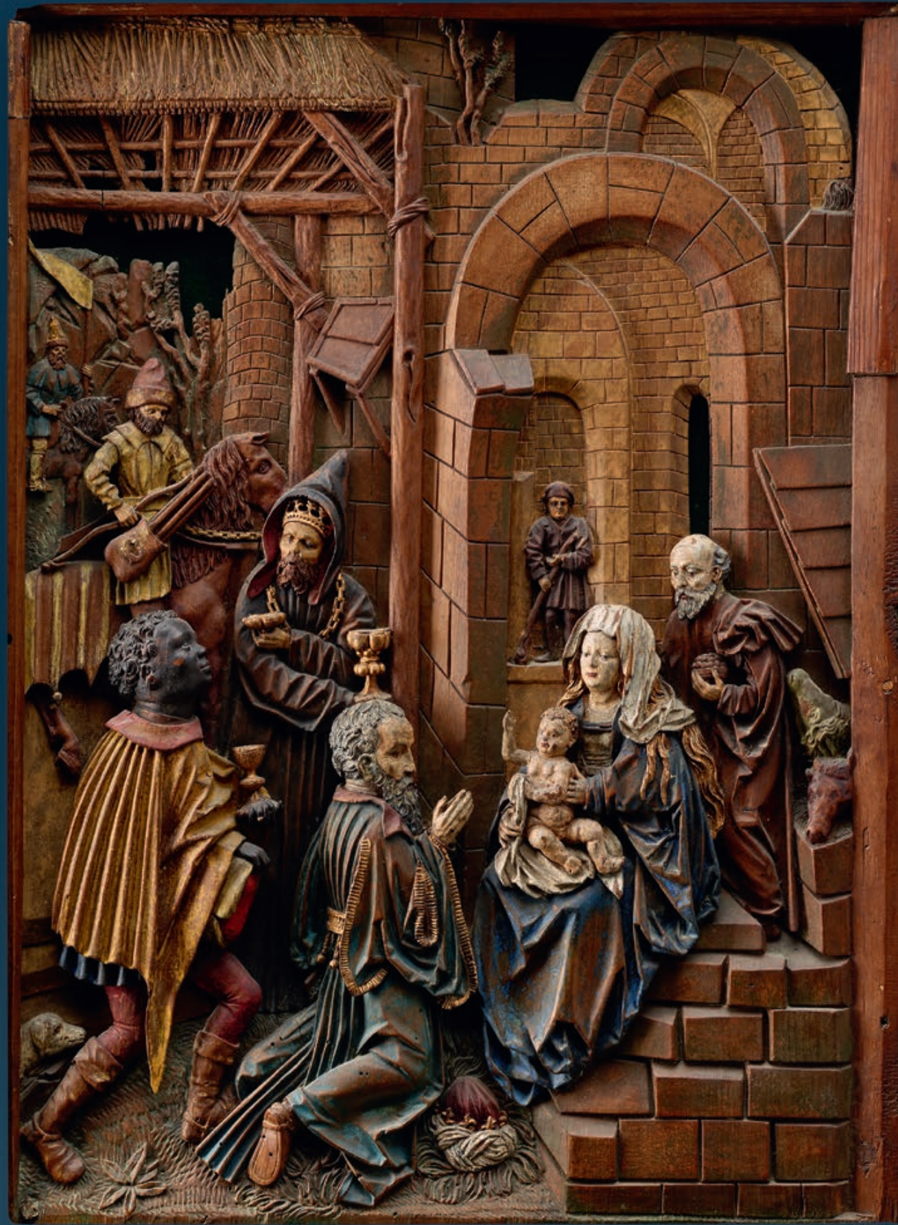
„Anbetung der Könige“ Umkreis Hans Burgkmairs des Älteren (1473 – 1531 in Augsburg) nach einer Stichvorlage von Albrecht Dürer Augsburg, um 1520 Relief, Lindenholz, originale Fassung Höhe: 58,5 cm, Breite: 44,5cm