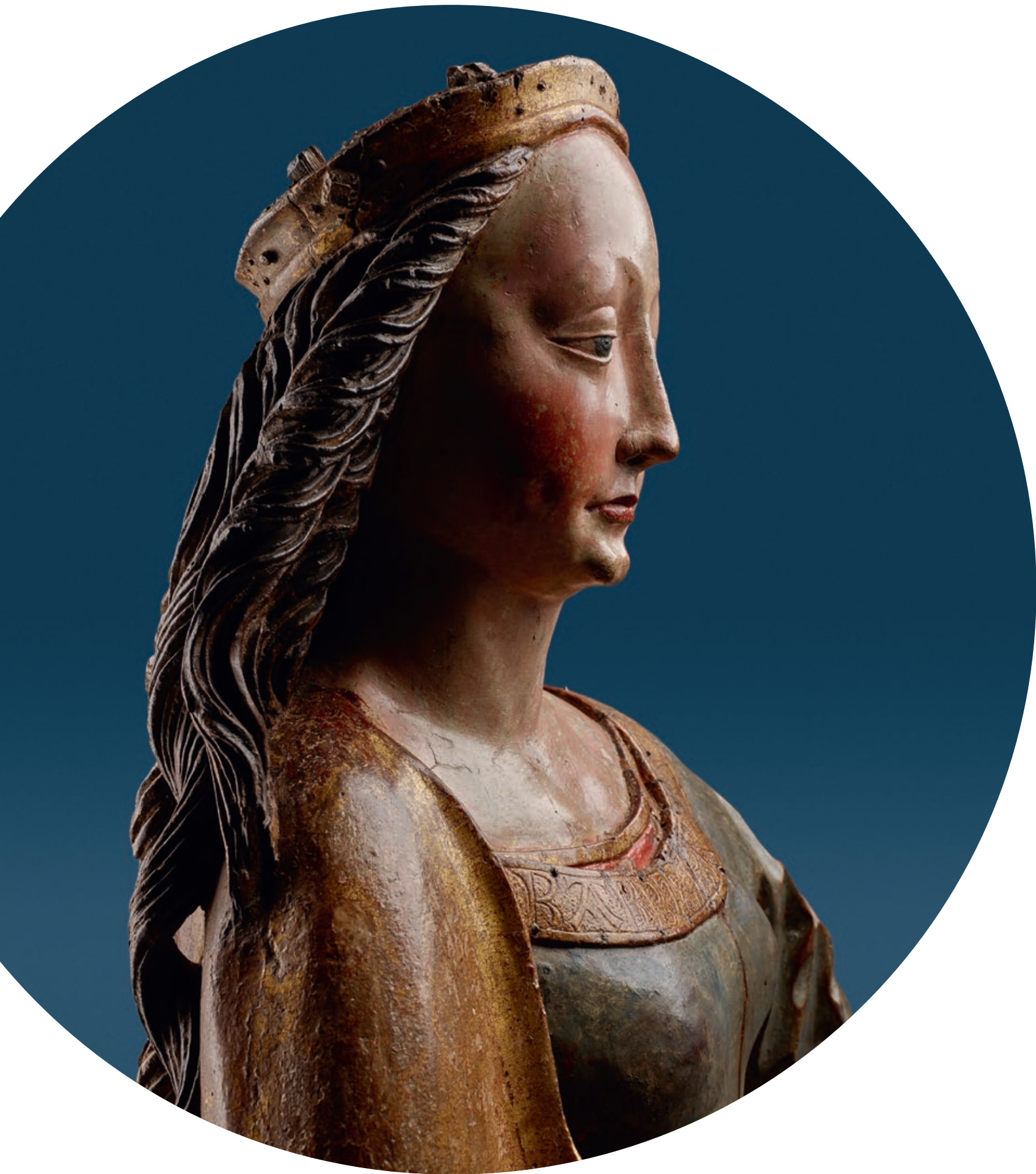
Heilige Barbara Umkreis Lienhardt Astl (tätig erstes Viertel 16. Jh.) Oberösterreich, Hallstatt, um 1500/10 Lindenholz, vollrund geschnitzt, originale Fassung Höhe: 135 cm