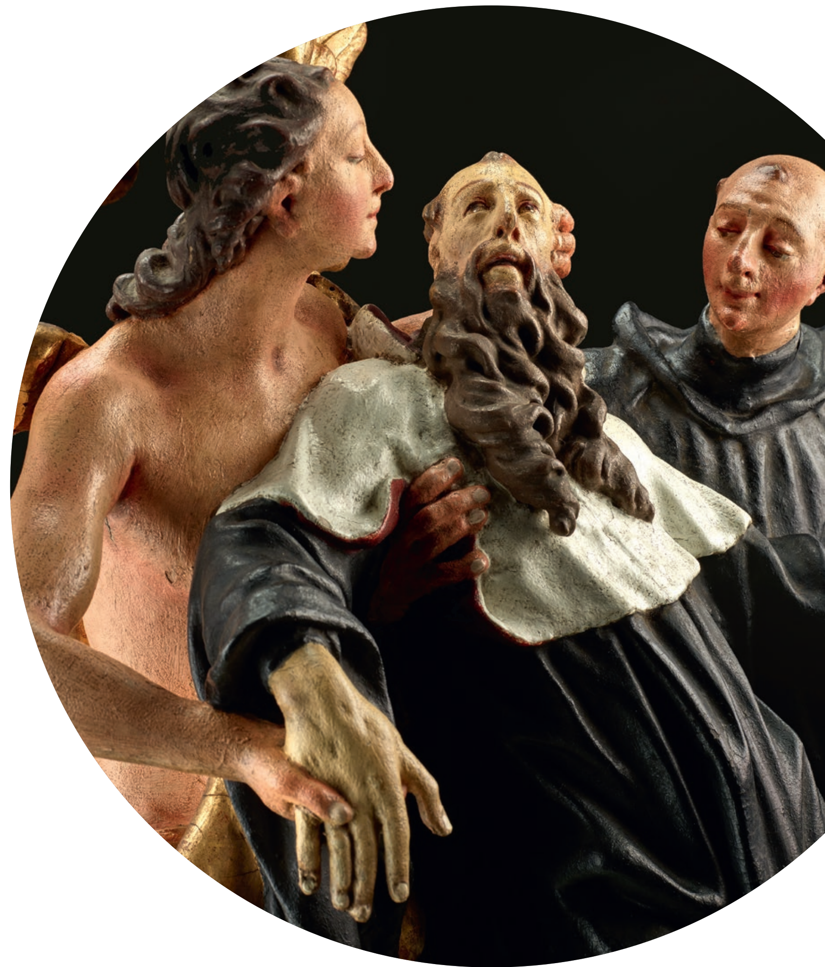
„Death of Saint Benedict“ Anton Sturm (1690 Faggen, Tyrol - 1757 Füssen) Füssen, circa 1755/56 Linden wood, full-round sculpture, old polychromy Height: 61.5 cm