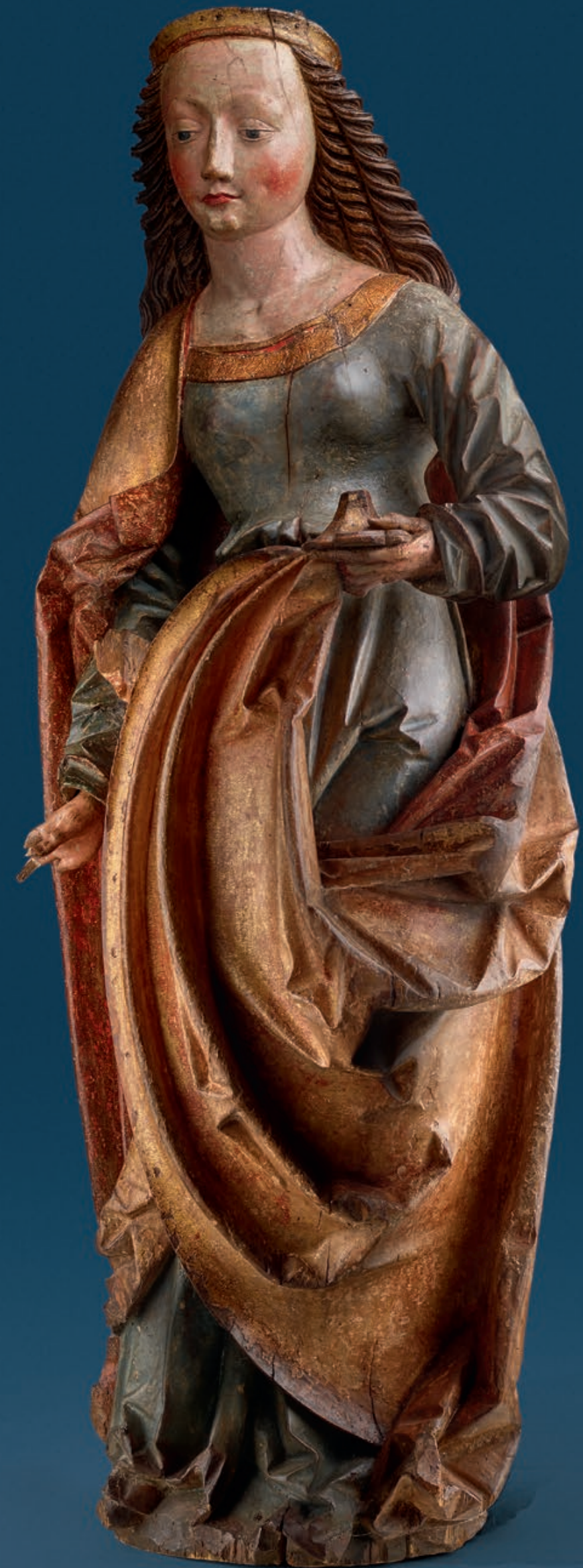
Saint Barbara Circle of Lienhardt Astl (active first quarter of the 16th century) Upper Austria, Hallstatt, circa 1500/10 Linden wood, full-round sculpture, original polychromy Height: 135 cm