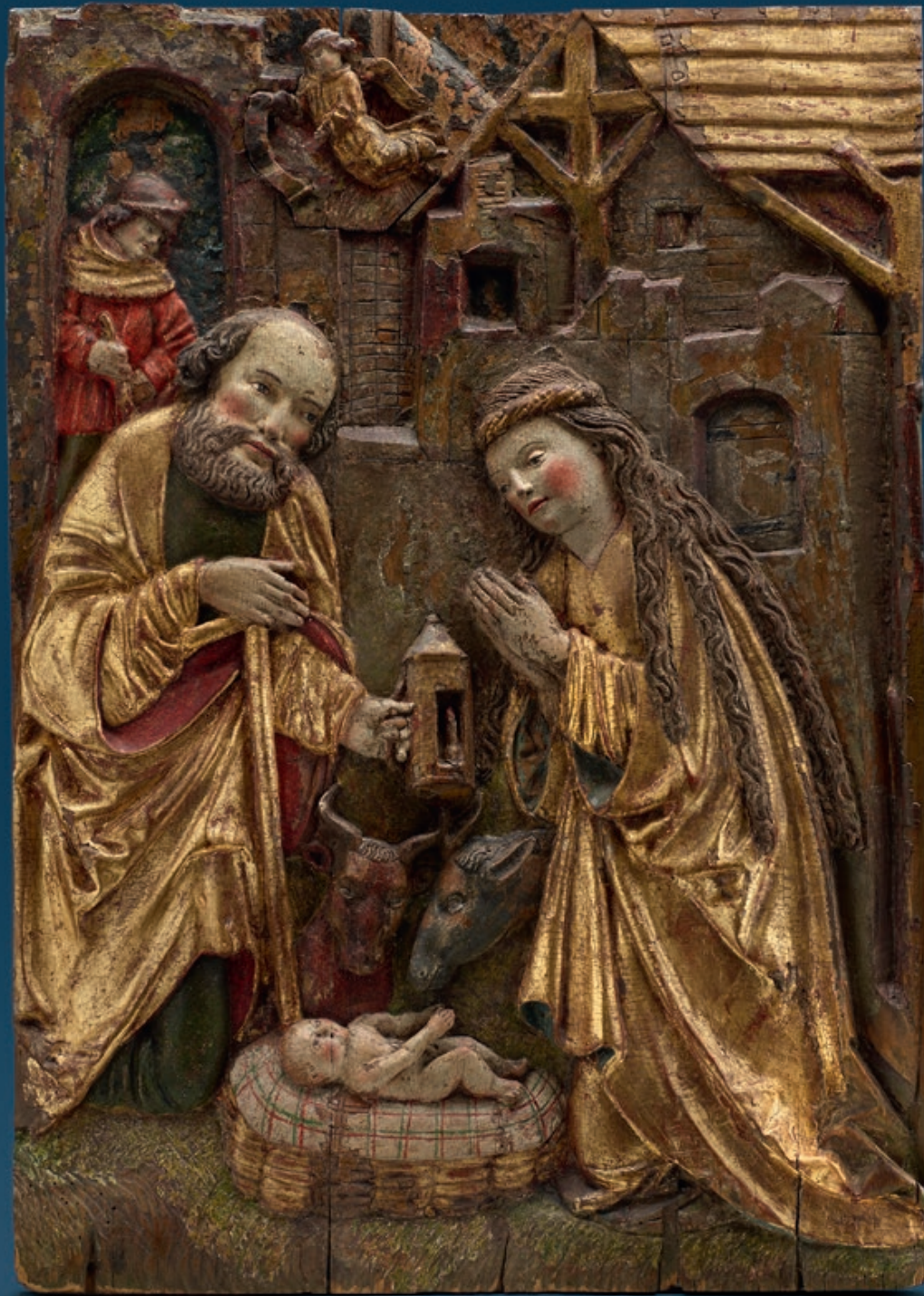
Geburt Christi Werkstatt des Hans Schnatterpeck (Mitte des 15. Jh. in Landsberg am Lech - ca. 1510, tätig in Meran) Südtirol, um 1480/1500 Relief, Lindenholz, geschnitzt größtenteils mit Resten der ursprünglichen Fassung und Vergoldung Höhe: 66,5 cm, Breite: 47 cm