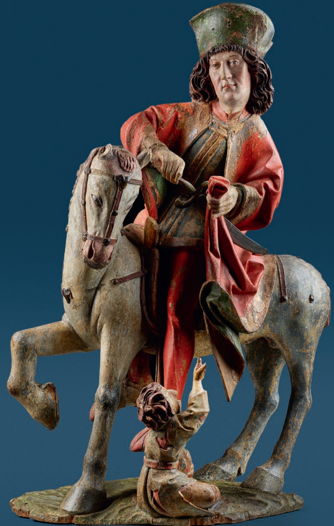
Saint Martin Workshop of Hans Schnatterpeck (middle of the 15th century in Landsberg am Lech – circa 1510, active in Meran) South Tyrol, circa 1490/1500 Linden wood, full-round sculpture, original polychromy Height: 72 cm