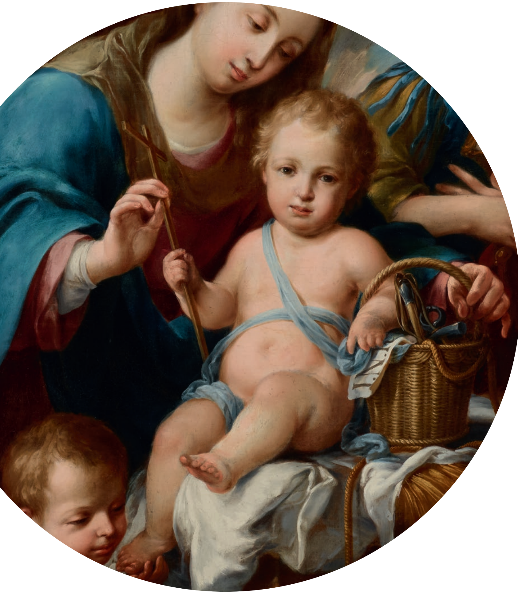
„Heilige Familie mit den Erzengeln Michael und Gabriel“ Umkreis des Bartolomeo Guidobono (1654 Savona – 1709 Turin), auch bekannt als il Prete di Savona Genua, um 1690 Öl auf Leinwand Höhe: 171 cm, Breite: 110 cm