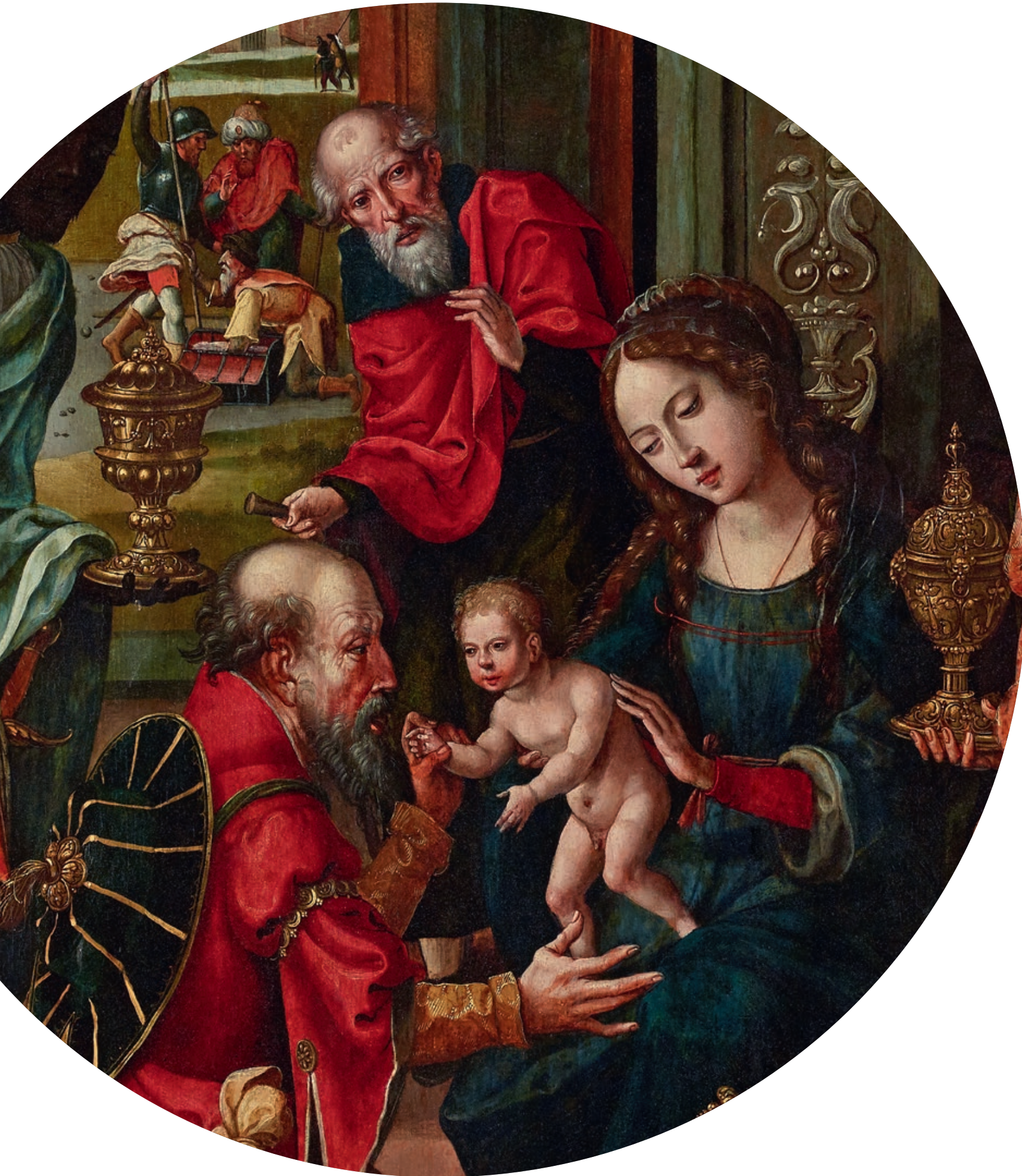
„Anbetung der Könige“ Nachfolger des Pieter Coecke van Aelst des Älteren (1502 Aelst – 1550 Brüssel) Brüssel, um 1525/1530 Öl auf Holz Höhe: 105,5 cm, Breite: 69 cm