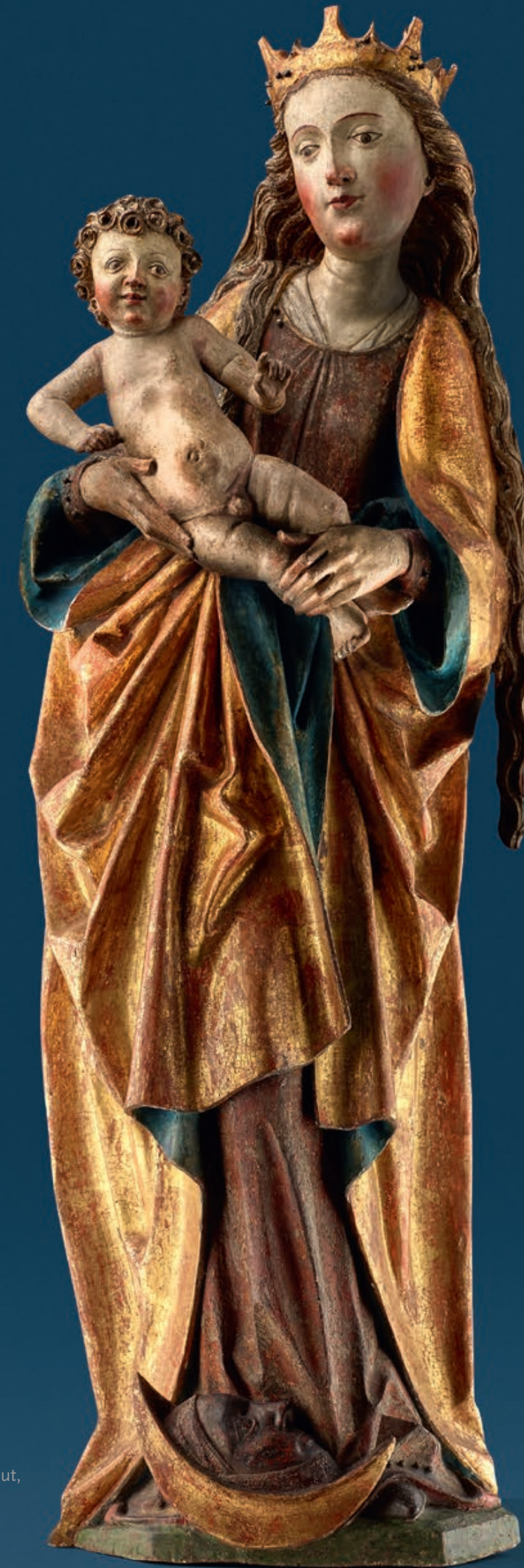
Maria mit Kind Nürnberg, um 1480/90 Lindenholz, rückseitig gehöhlt, originale Fassung Höhe: 107 cm