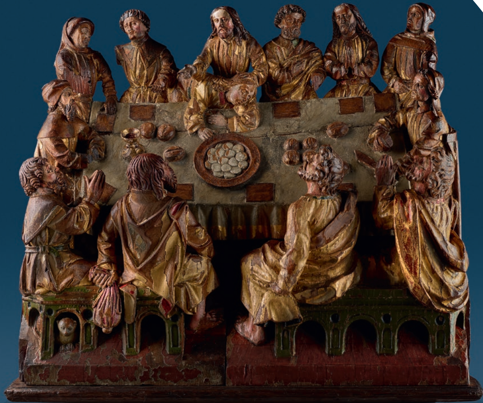
„Das letzte Abendmahl“ Antwerpen, um 1500 Eichenholz, originale Fassung Höhe: 52 cm, Breite: 60 cm, Tiefe: 22 cm