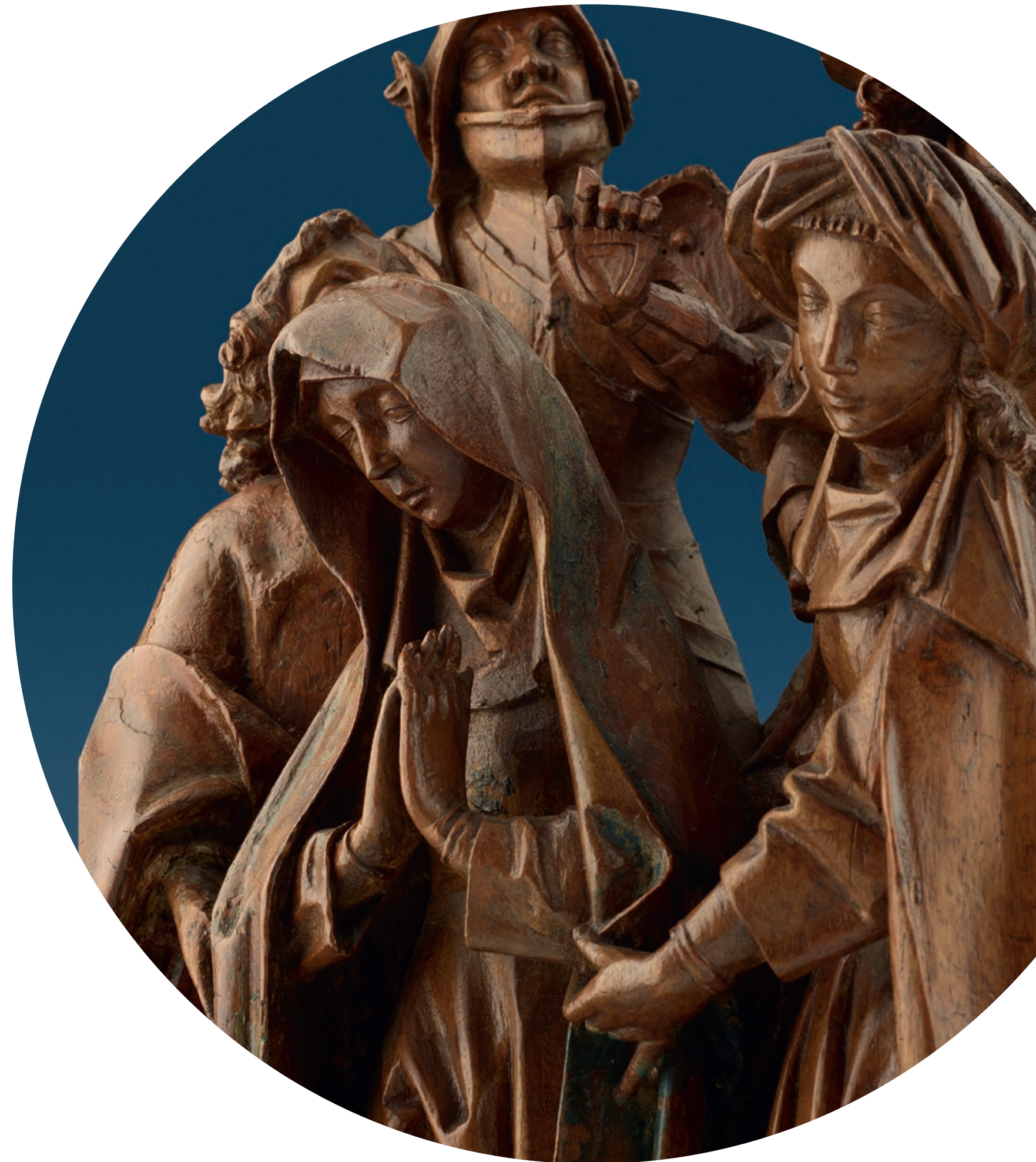
„Mourning of Christ“ Brussels, circa 1500 Walnut wood, full-round sculptures Height: 44 cm, width: 30 cm, depth: 15 cm