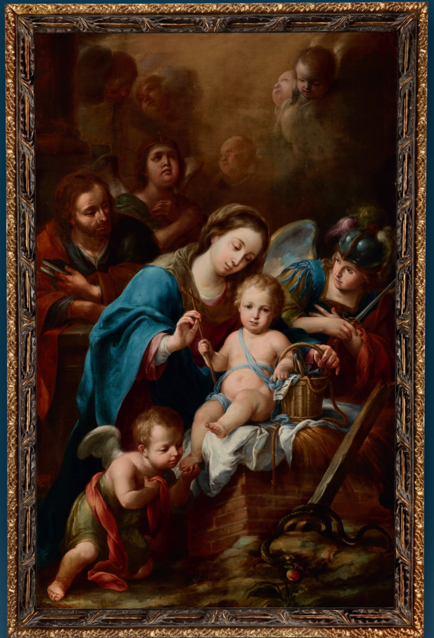
„Holy Family with Archangels Michael and Gabriel“ Circle of Bartolomeo Guidobono (1654 Savona – 1709 Turin), also known as il Prete di Savona Genoa, circa 1690 Oil on canvas Height: 171 cm, width: 110 cm